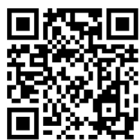
어린이집 평가제 홈페이지